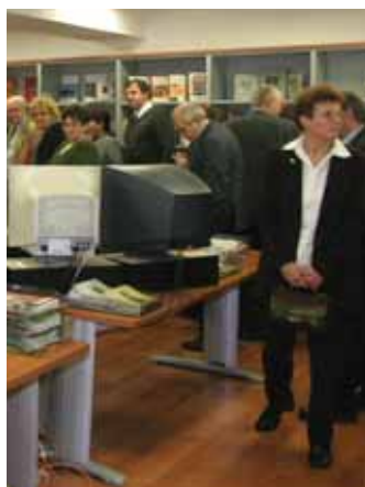
Tanácsülés közben, és nyomda-látogatások a résztvevők a Prime Rate új épületében