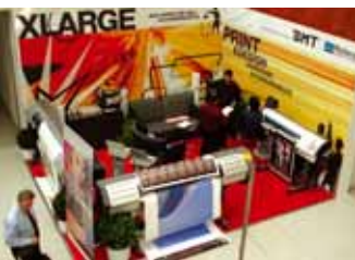
Képek a DataPrint kiállításáról

Nemzetközi nyomdatechnika, nyomdai előkészítés és digitális termelés szakvásár a Design Center Linz kiállítási csarnokban. Az előző kiállítást is közel 6000 szakmai látogató tekintette meg. A megcélzott országok: Ausztria, Németország, Olaszország, Svájc, Csehország, Szlovákia, Magyarország, Szlovénia, Horvátország szakemberei több mint 100 kiállító (belföldi: 79, külföldi: 21) által bemutatott gépeket, eljárásokat és szoftvereket láthattak. A viszonylag kis alapterületű kiállítási csarnokban jól áttekinthetően, szellősen berendezett standokon többségben voltak a digitális nyomtatás gyors elő-