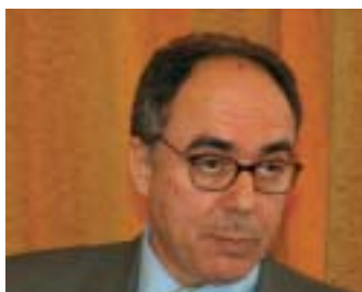
Néhányan a rendezvény előadói közül, és a hallgatóság...

Amíg a nyomtatás a nyomathordozóra kerül... címmel egyetemenk egyik legsikeresebb, a vándorgyűlés után a legnagyobb résztvevőszámmal büszkélkedő rendezvényére került sor október 28–29-én, Zalaegerszegen. Az előadások színhelye az Aranybárány Hotel volt, ahol az esti banketten a csaknem kétszáz fő résztvevő megbeszélhette az előadáson hallottakat.